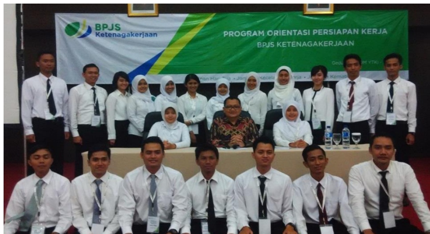
Materi GG dalam Diklat Orientasi Persiapan Kerja 25 Januari 2015