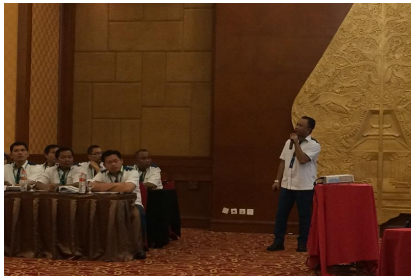
Sosialisasi GG di Rakorda Kanwil Jawa Tengah DIY