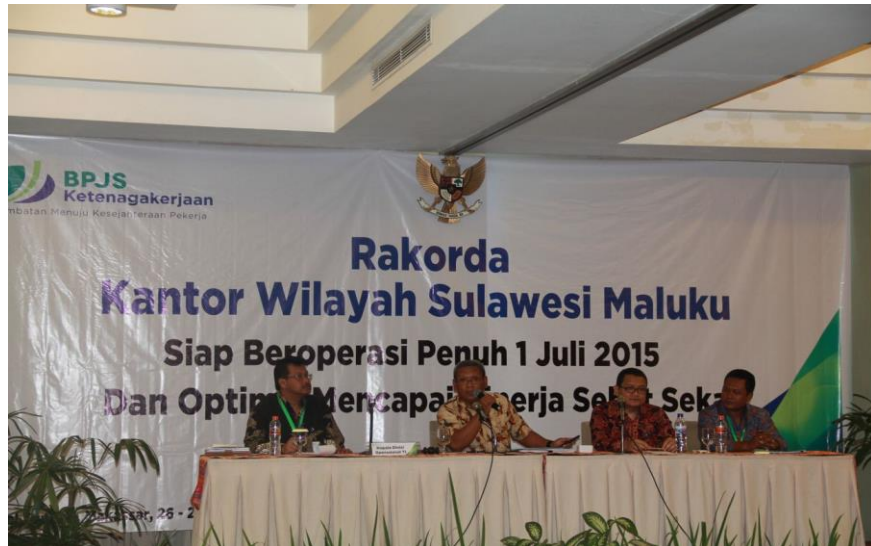
Sosialisasi GG di Rakorda Kanwil Sulawesi Maluku