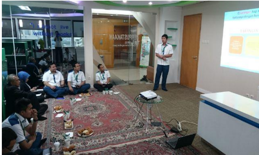
Sharing Session tentang Pengendalian Benturan Kepentingan (Conflict of Interest)