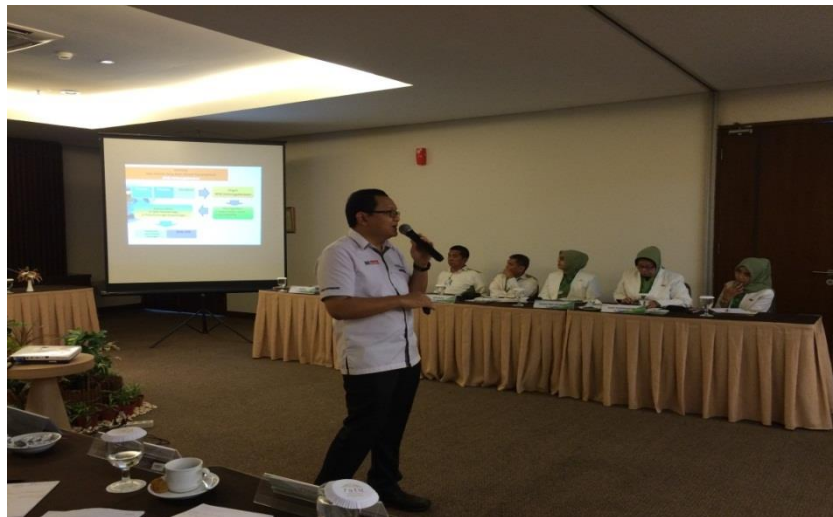
Sosialisasi GG di Rakorda Kanwil Banten