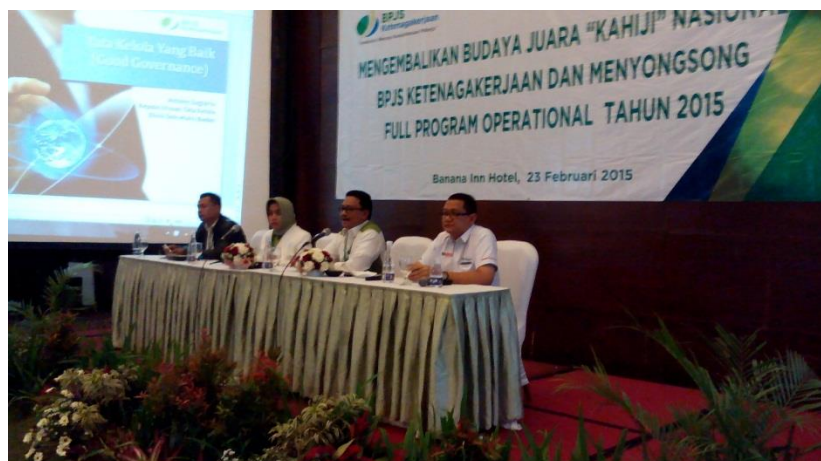
Sosialisasi GG di Rakorda Kanwil Jawa Barat