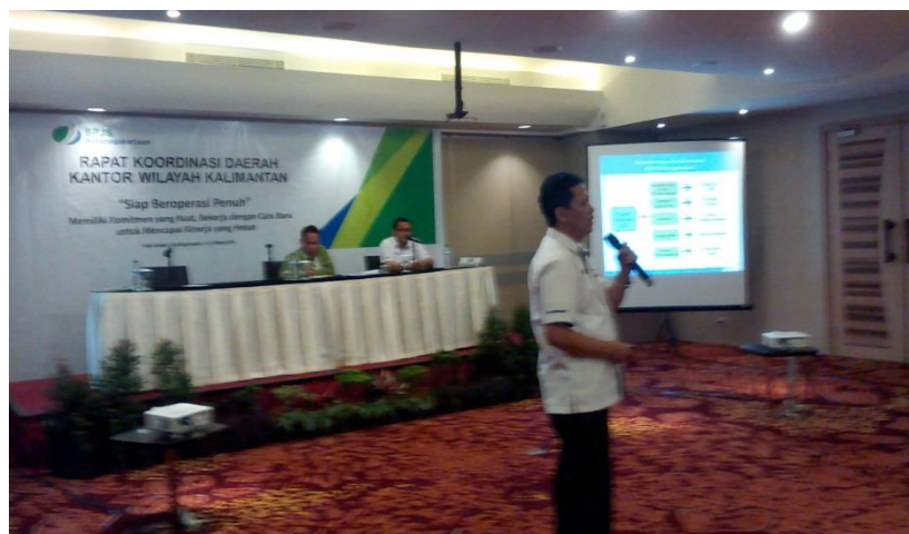
Sosialisasi GG di Rakorda Kanwil Kalimantan