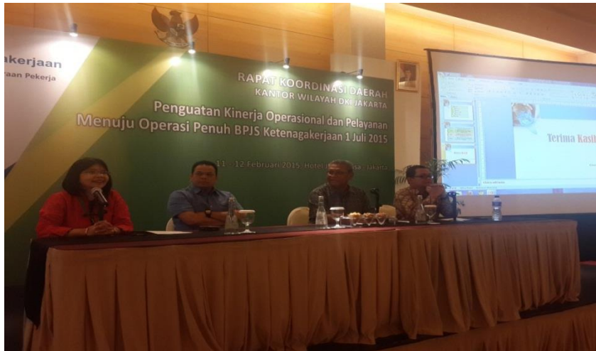
Sosialisasi GG di Rakorda Kanwil DKI Jakarta